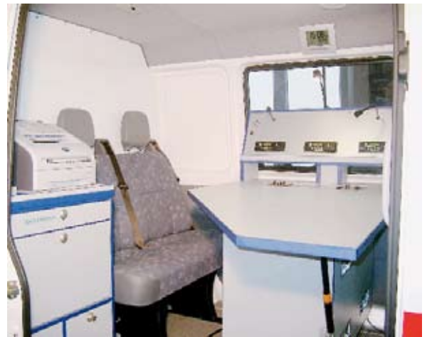
Abb. 2: Im Innern des ELW befindet sich der Funktisch mit drei Arbeitsplätzen

Am 20. Juli konnte der ELW vom Typ Mercedes-Benz Sprinter 313 cdi Allrad (95 kW/129 PS) an die Hilfsorganisationen übergeben werden. Der Malteser Hilfsdienst Freiburg ist der Halter des ELW, die SIGR bleibt Eigentümerin. Das Fahrzeug wurde durch die Firma