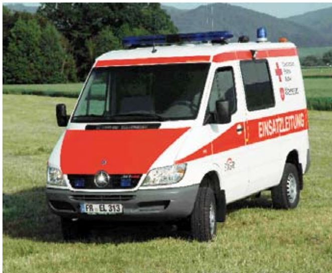
Abb. 1: Der neue ELW für den Rettungsdienstbereich Freiburg/Breisgau-Hochschwarzwald

Hilfsorganisationen und Kostenträger klagen gleichermaßen über leere Kassen. An die Beschaffung zusätzlicher Einsatzmittel ist vielerorts nicht zu denken. Von dieser unbefriedigenden Situation ist auch der Rettungsdienstbereich Freiburg/Landkreis Breisgau-Hochschwarzwald betroffen, wo sich dies insbesondere